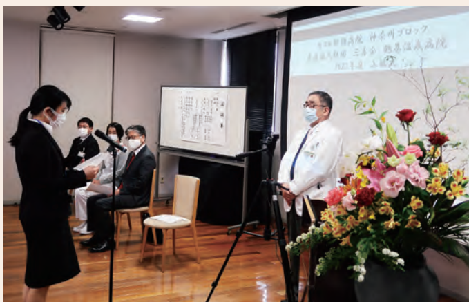
2021年度入職式で新入職員宣誓をする新入職者

そんな中、鶴巻温泉病院にも41名の新人が入職してくれました。授業や実習もままならず、友達とも会えない、騒げない、卒業式もきちんとできない状況だったと思います。それでも資格試験を受けて、頑張ってきました。人と人は直接会い、触れることで、良くも悪くも、心が揺さぶられ、感情が昂がり、若い心は成長していきます。それが制限されたコロナ禍は、本当に辛い、悲しい出来事です。